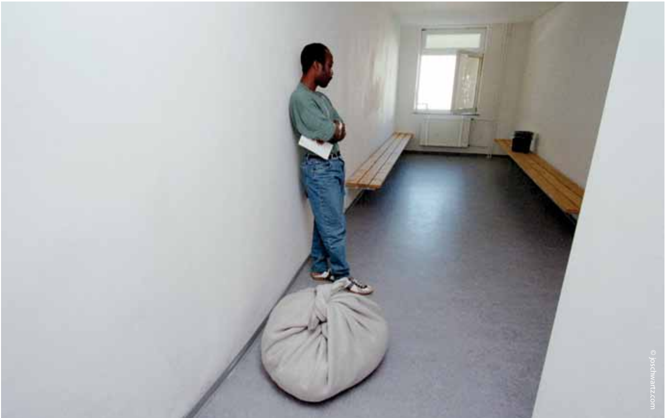
JVA Büren: Ein Häftling wartet mit gepackten Habseligkeiten und Abschiebepapieren auf den Transport zum Flughafen.