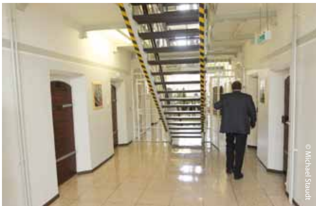
Ein Alltag zwischen Langeweile und Überwachung Bilder aus der Abschiebungshaft in Rendsburg