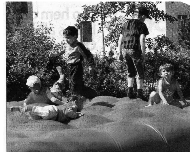
Auf der Hüpfburg war immer viel los und die Kinder hatten ihren Spaß.