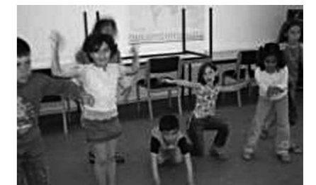
Theaterprojekt in der Asylbewerberunterkunft Satower Straße

Information zu „Lichtpunkte“: www.dkjs.de // www.lichtpunkte.info