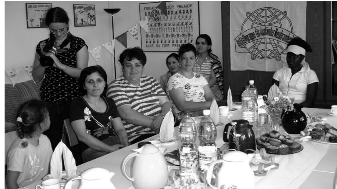
Neubrandenburg // Eröffnungsfeier am 26.06.2008