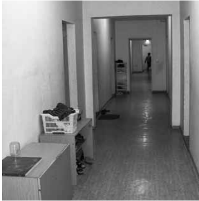
Flur einer GU