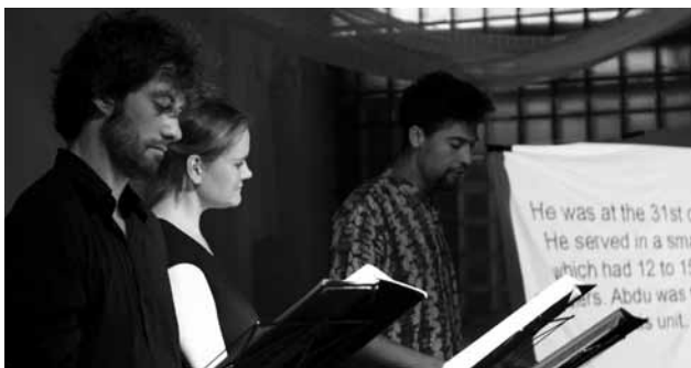
Asyl-Monologe der Bühne für Menschenrechte - gleich zweimal in MV. Am 26.9. in Schwerin und am 27.9. in Rostock