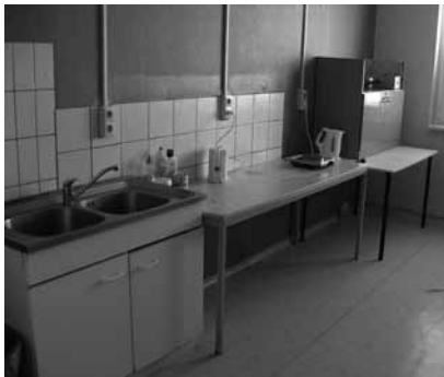
Gemeinschaftsküche einer GU

1. Sechs Quadratmeter – so viel stehen jedem Flüchtling als Wohnfläche zu – sind eindeutig zu wenig. In der Praxis leben Flüchtlinge oft zu dritt in einem Raum von 20 qm oder eine größere Familie erhält zwei Zimmer, aber vielfach werden die Flure noch als Abstellgelegenheit genutzt.